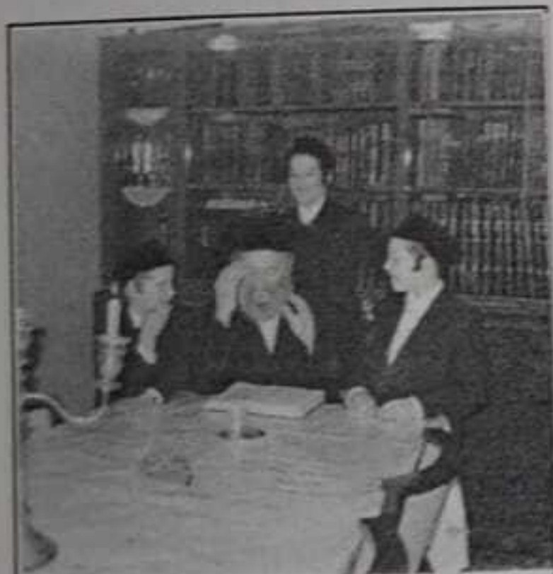
נאך אן הברלה, בשעת'ן רעאגירן צום בילד...

דאס לערנען גמ' וכו' איז נישט געווען בלויז א לייכטער לימוד