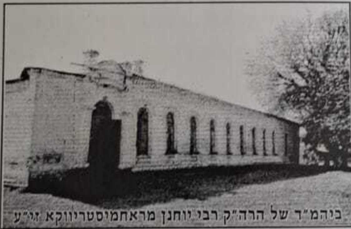
בניהמ"ד של הרה"ק רבי יוחנן מראחמיסטריווקא זי"ע

כ"א אדר שנת תשס"ד לפ"ק בניהמ"ד ראחמיסטריווקא מאנסי נ.י.