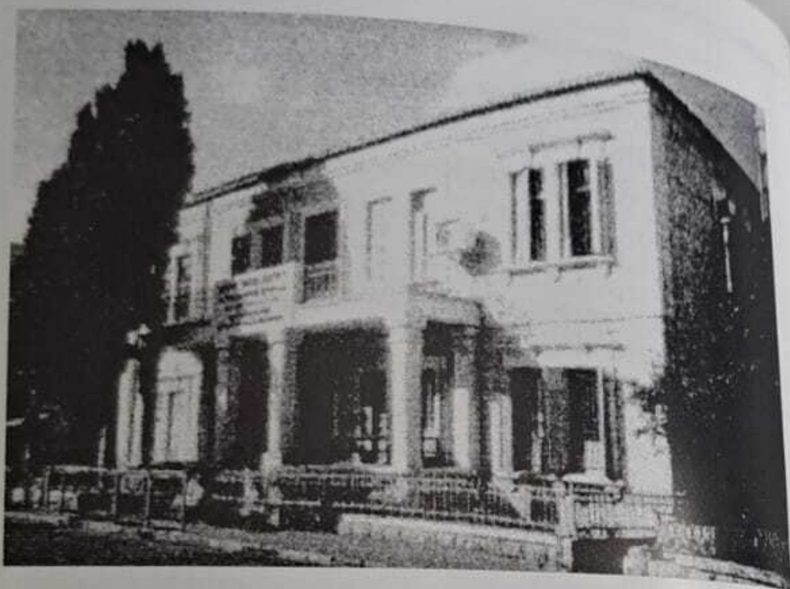
חצר הקודש ראחמיסטריווקא - ירושלים עיה"ק