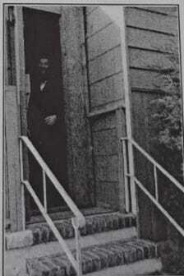
In the Sucah, Chol ha'Moed

And, as with every mitzvah he did, his learning