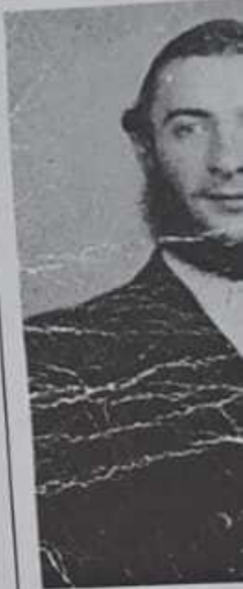
Reb Moshe that he s was h

May the Chasidim shield and all our pe speedily in our