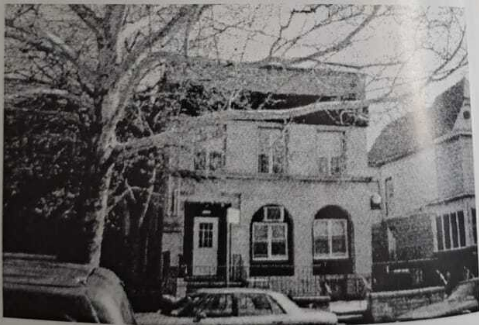
חצר הקודש ראחמיסטריווקא - בארא פארק

מן מדבק זיין אין זיינע אר אונז א מליץ יושר זוב זוכה זיין צו ביאת בעזר השם מיט אים